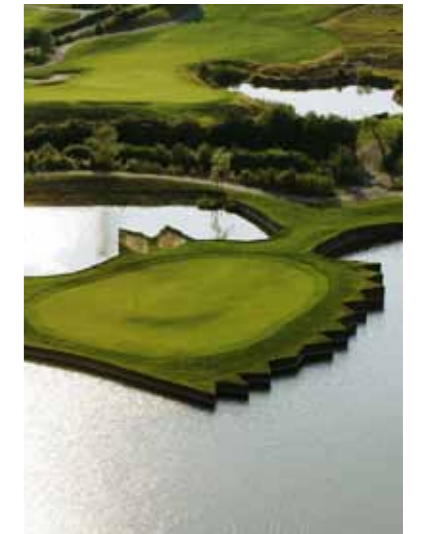
Hardenberg Golf Resort, Northeim / Almanya