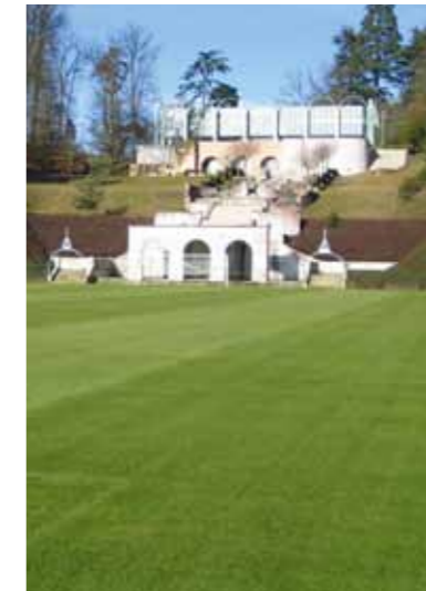
Clairefontaine Training Center, Fransa Milli Takımı Antrenman Sahası Clairefontaine / Fransa